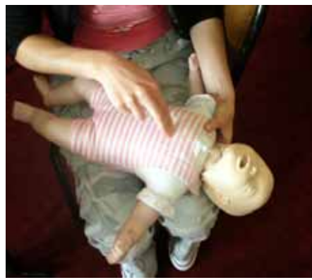
Gestes d'Urgence en pédiatrie