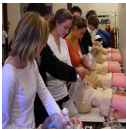
Atelier prise en charge ventilatoire