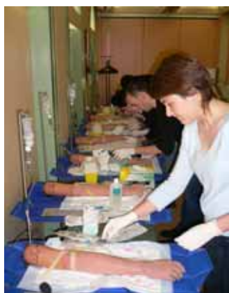
Atelier pose de perfusions