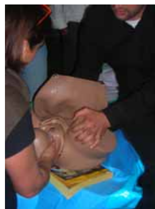
Atelier accouchement inopiné