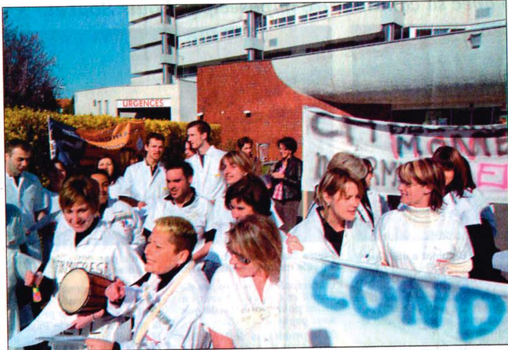
Une centaine d'étudiantes et d'infirmières rassemblées, ici sur le site de Montbéliard.

« Bac plus 3 non reconnu : on veut la licence ! » proclamaient les banderoles brandies. Voilà, en effet, un des leitmotifs de la profession qui souffre d'un manque de reconnaissance. « La licence infirmière, pourtant promise par le ministre, existe dans d'autres pays européens. Nous, nous avons appris le 13 février dernier qu'elle ne nous se-