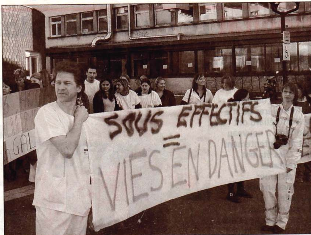
Les infirmiers veulent davantage de reconnaissance.

À l'appel de la CNI (Coordination nationale infirmière), elles ont manifesté hier. Les blouses blanches se sentent toujours ignorés. Ignorés par rapport aux salaires, par rapport à la reconnaissance du diplôme et surtout ignorés dans les difficultés face aux conditions de travail. « Sous-effectif = vie en danger » écrivent les manifestants sur leurs banderoles.